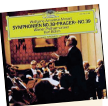
Sinfonía 38 / Mozart Artista: Filarmónica de Wiener Género: orquestal Disquera: Grammophon

La Filarmónica de Wiener ejecuta el adagio con espléndido desempeño, mientras el alegre fluye con limpieza de chispeante proporción. Intenso andante. Presto de equilibradas progresiones. Recomendable grabación