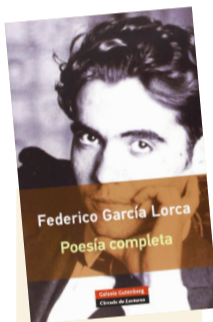
Poesía Completa Autor: Federico García Lorca Género: Poesía Editorial: Galaxia Gutenberg, 2016

Poesía Completa , de Federico García Lorca: dieciocho años de trabajo con la palabra. Desde los primeros textos hasta el fusilamiento de Viznar. Qué privilegio tener en un solo volumen toda la producción poética de Lorca. Soy dichoso. Imaginario lorquiano : de lo local a lo cosmopolita, de lo andaluz a los vaivenes neoyorquinos, de la palabra sagaz a la frondosidad metafórica. / Lorca en ronda por estos días imprecisos. “El mundo solo por el cielo solo”.